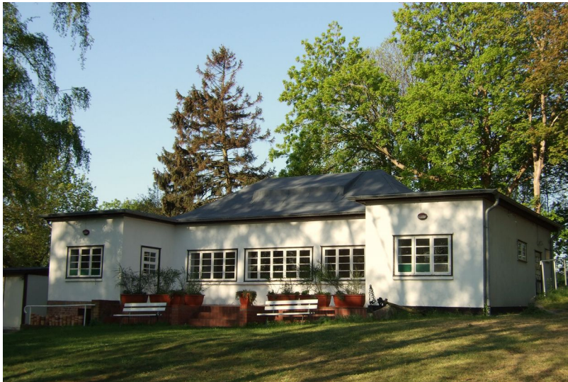
Kurshaus, Baujahr 1934