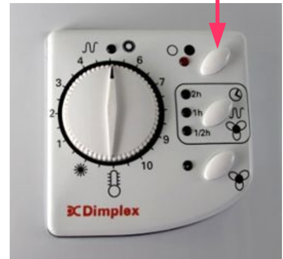
Heizung im Bad