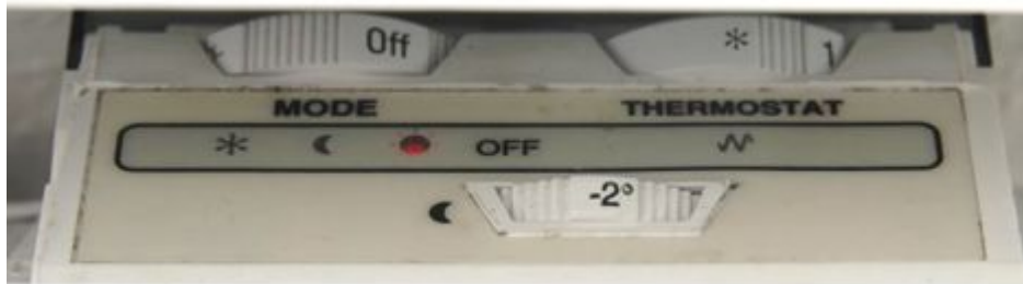
Heizung im Zimmer